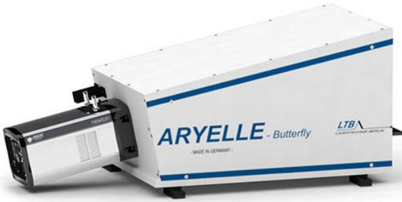
Model: ARYELLE400 Butterfly Typical Setup